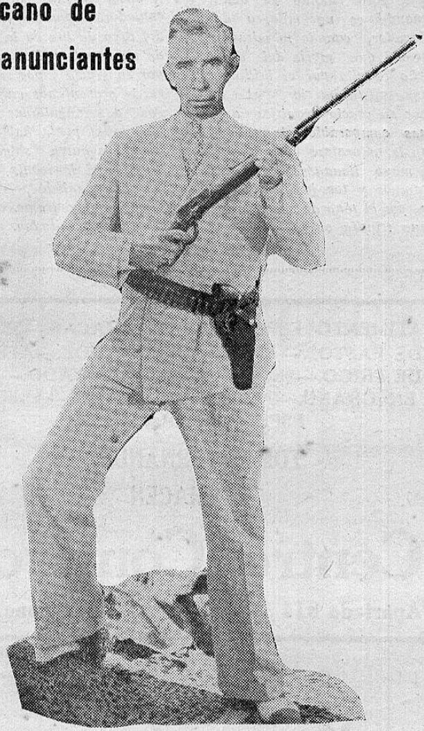
Hace ya casi seis años que por primera vez circuló La Semana Cómica, siendo siempre un periódico amigable. Pasa a la Página Ocho