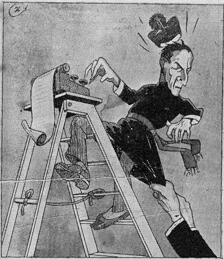
—¡Padre, Padre!, dice un cable de Berlín que a usted lo van a nombrar capellán del ejército nazi...